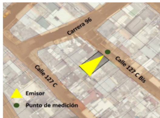
Figura 1. Ubicación del predio emisor y punto de medición